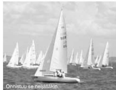
Onnistuu se neljälläkin.