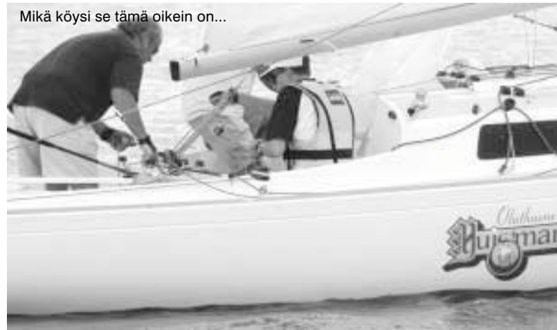
Mikä köysi se tämä oikein on...