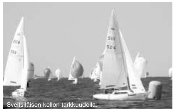
Sveitsiläisen kellon tarkkuudella.