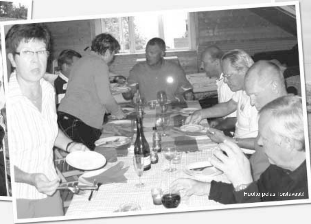
Huolto pelasi loistavasti!