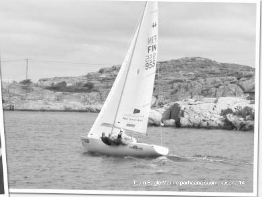
Team Eagle Marine parhaana suomalaisena 14.

Se että kilpailujen järjestäjä on kuninkaallinen pursiseura, ei välttämättä takaa sitä että Maailmanmestaruuskisojen järjestelyt ”hoituisivat” kunnialla!!!!