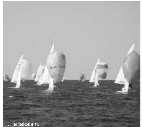
... ja takaisin.