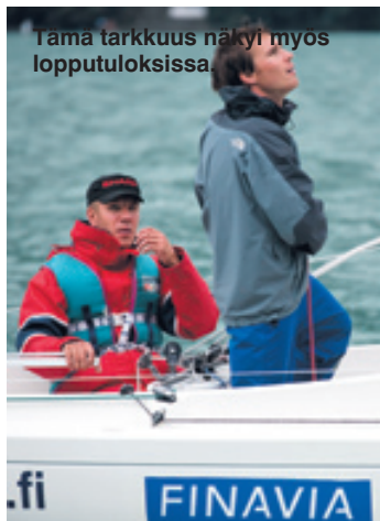
Tämä tarkkuus näkyi myös lopputuloksissa.