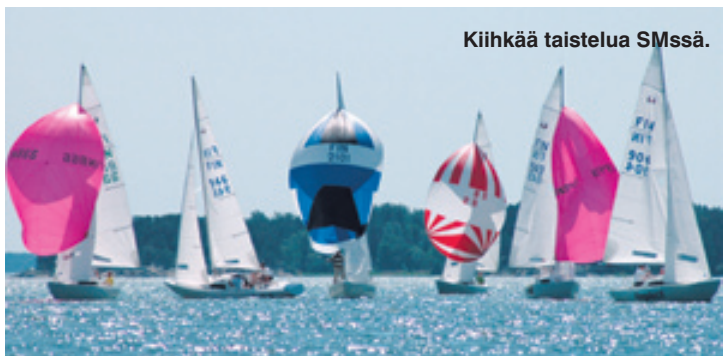
Kiihkää taistelua SMssä.