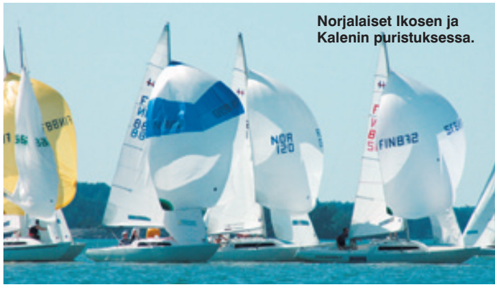
Norjalaiset Ikosen ja Kalenin puristuksessa.