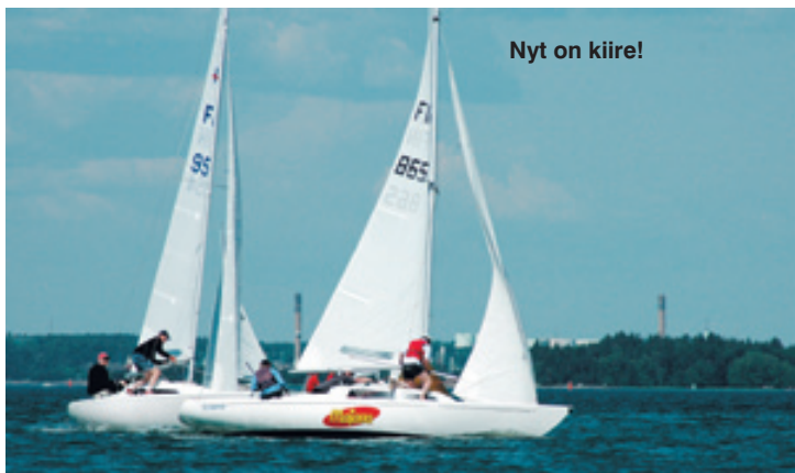
Nyt on kiire!