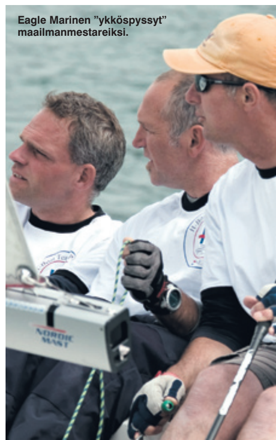
Eagle Marinen ”ykköspyssyt” maailmanmestareiksi.

Tämän vuoden MM-kilpailujen nettisivut löytyvät osoitteesta http://www.h-boat-worlds07.ch ja ensi vuoden kilpailujen osoitteesta http://www.h-boatworlds2008.com