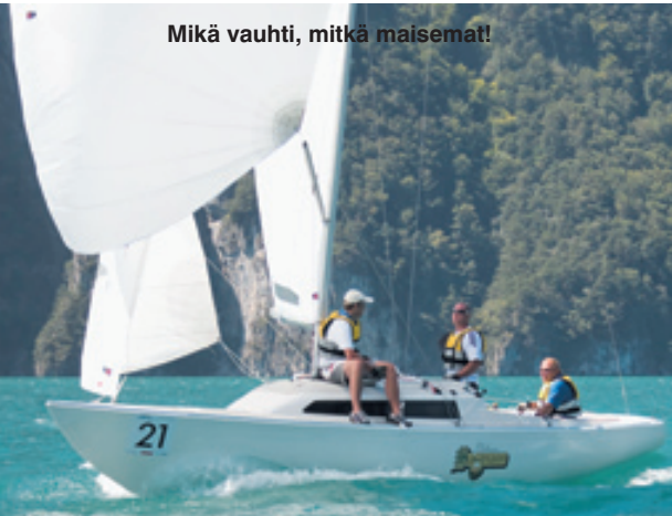
Mikä vauhti, mitkä maisemat!