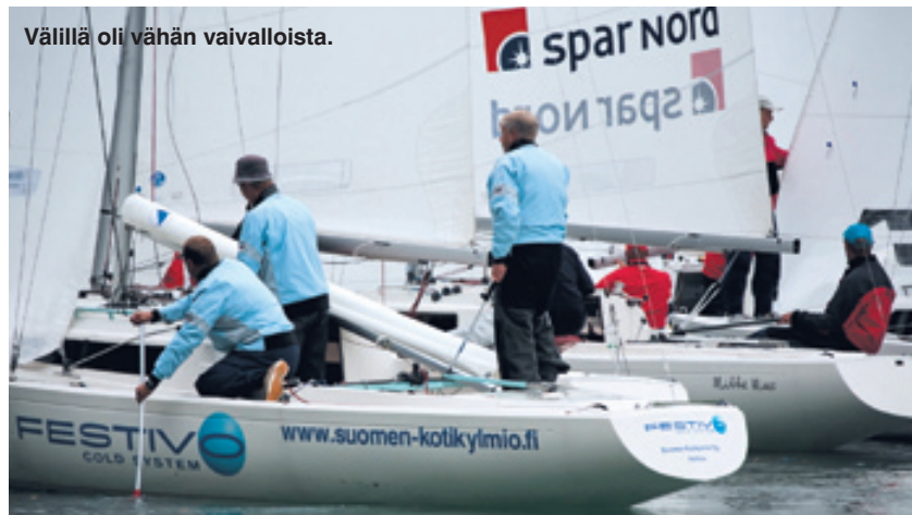
Välillä oli vähän vaivalloista.